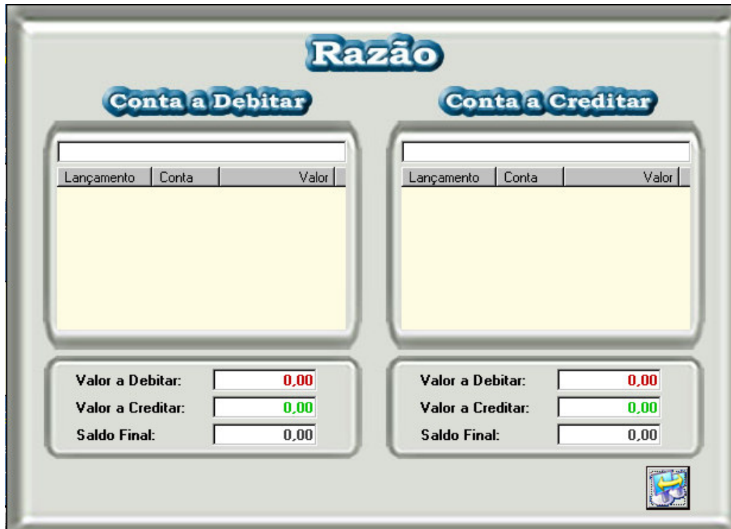
Figura – 02