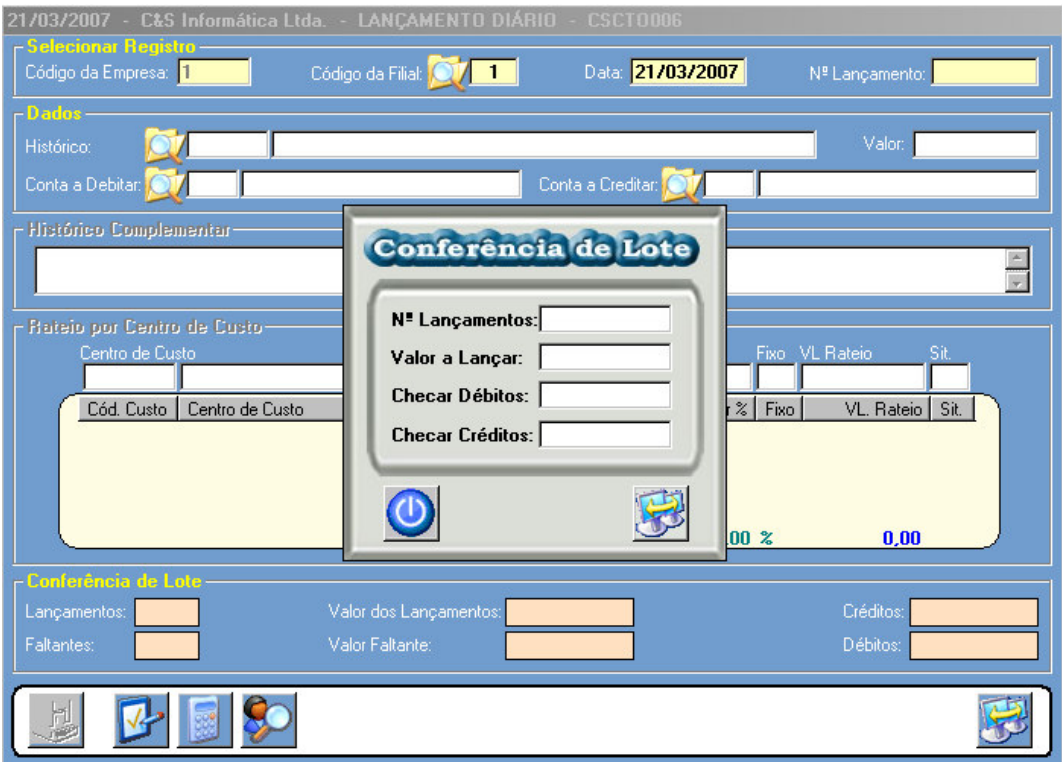
Figura – 01