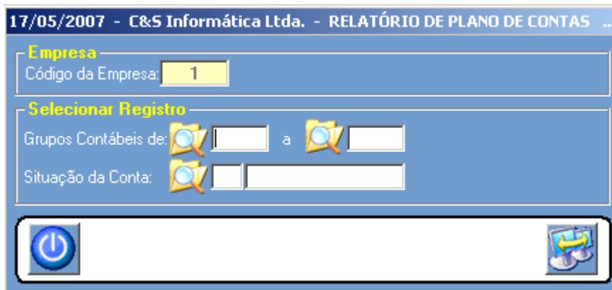
Figura – 01