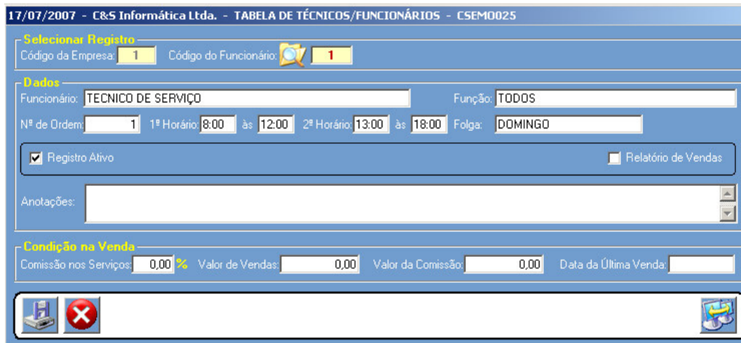
Figura - 02