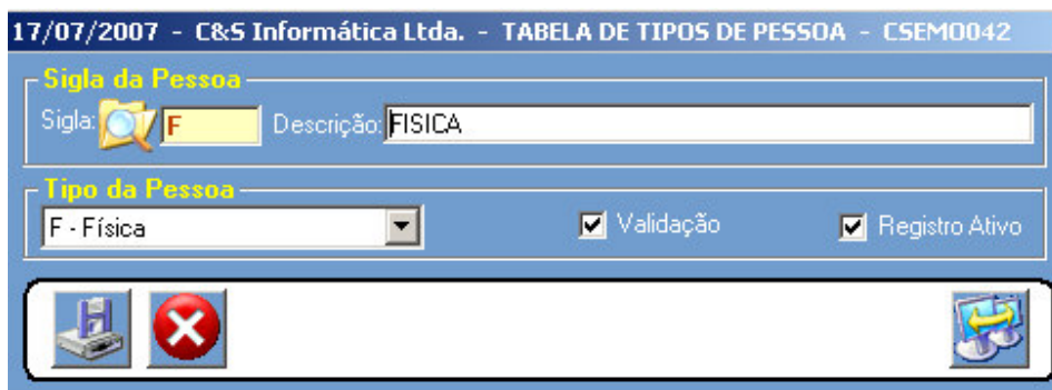
Figura - 03