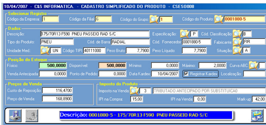
Figura - 02