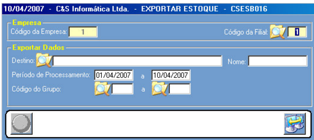
Figura – 01