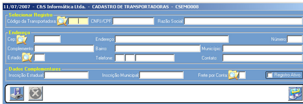
Figura – 01