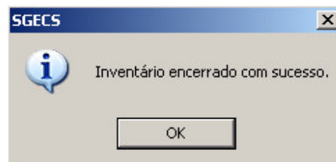
Figura - 05