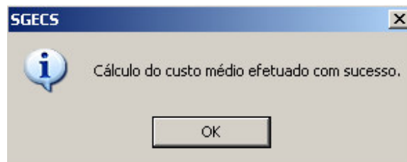
Figura - 04