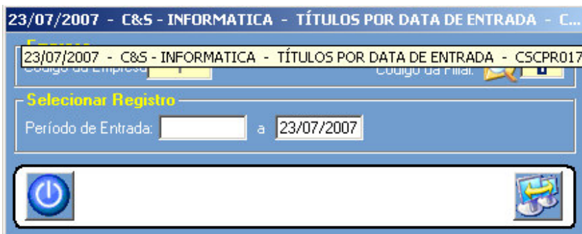
Figura - 01