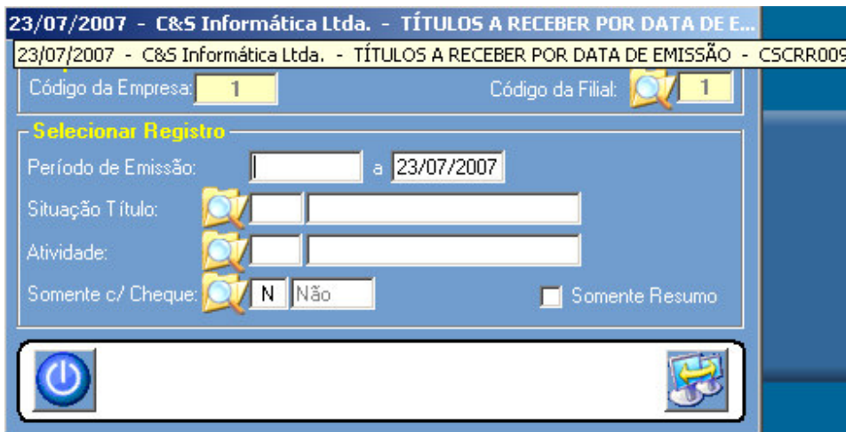
Figura - 01