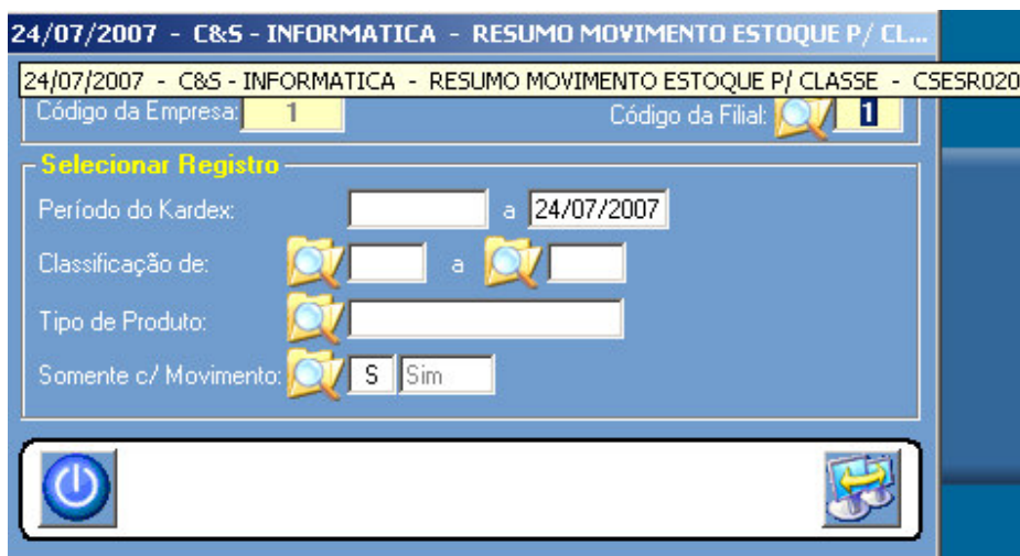
Figura – 01