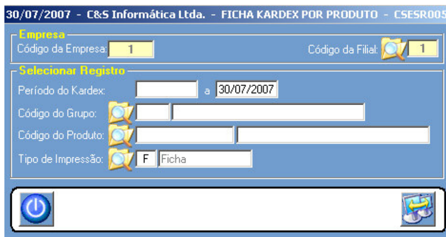
Figura – 01