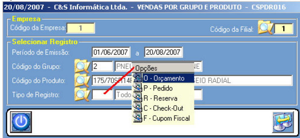
Figura – 02