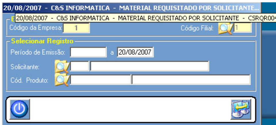
Figura – 01