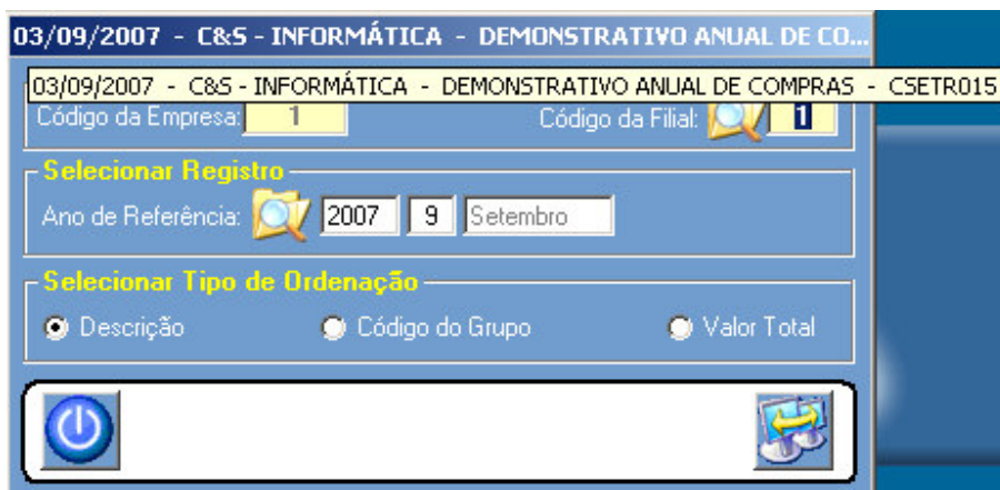
Figura – 01