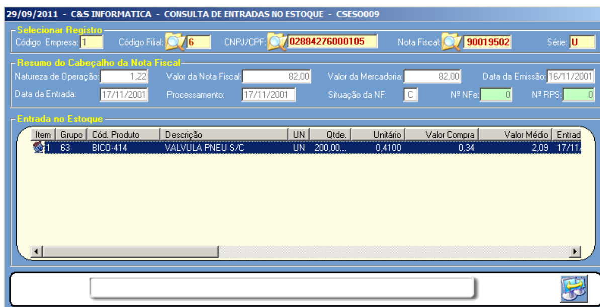
Figura - 02