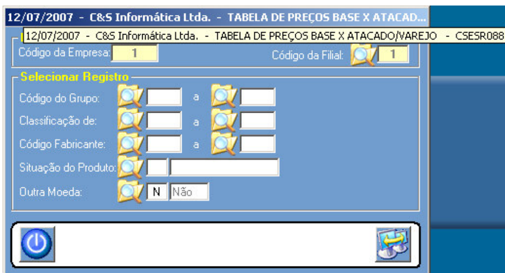
Figura – 01