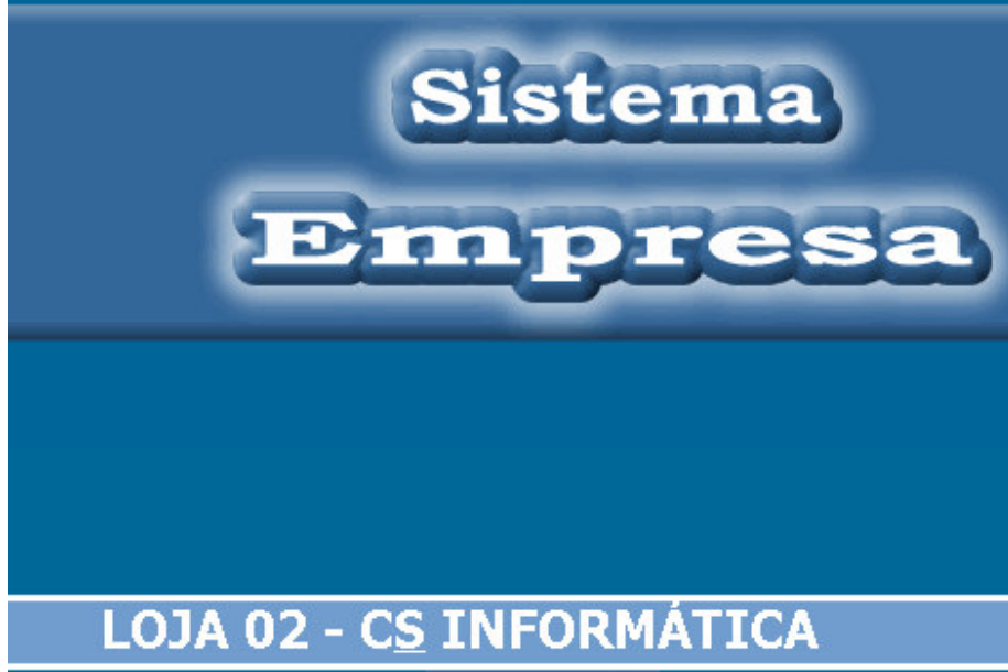
Figura - 05

Exemplo da tela quando locado na filial 02.