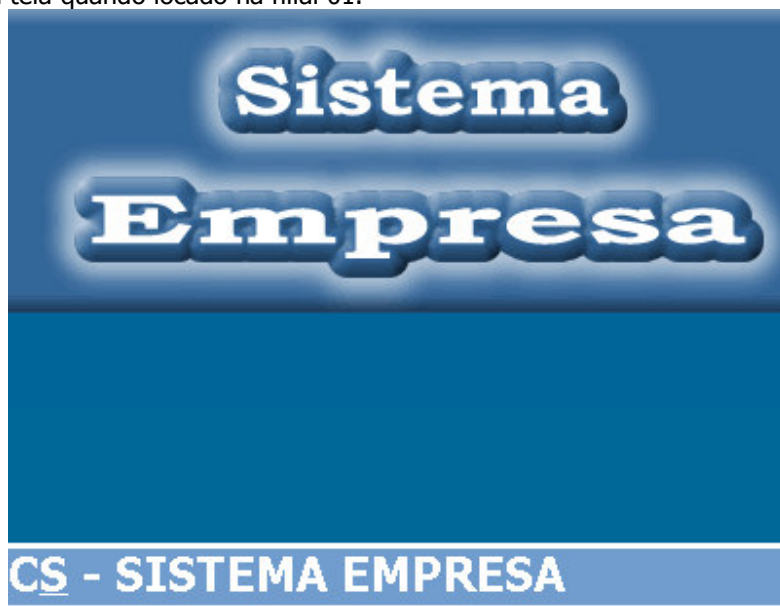
Figura – 03

Exemplo da tela quando locado na filial 01.