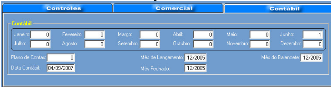
Figura - 03