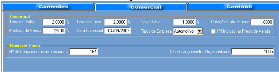
Figura – 02