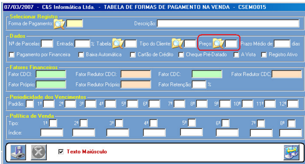
Figura - 01