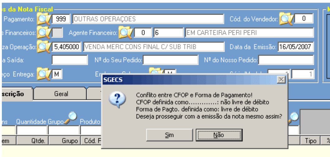
Figura - 02