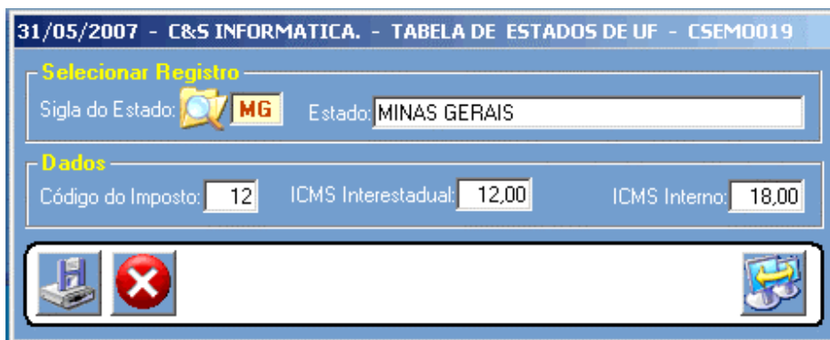
Figura – 01

NOTA Vendas fora do Estado ICMS Interestadual Venda Fora do Estado + Cliente Contribuinte (Cliente com Ins. Estadual) = o sistema usa alíquota ICMS Interestadual (estado de destino). ICMS Interno Venda Fora do Estado + Cliente Não Contribuinte (Cliente sem Ins. Estadual) = o sistema usa alíquota do ICMS Interno (estado de origem).