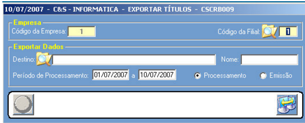
Figura – 01

Digitar o código da Filial desejada. Localizar um local para salvar o arquivo texto.