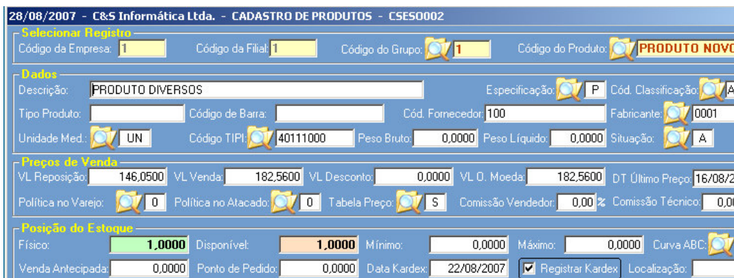
Figura - 02