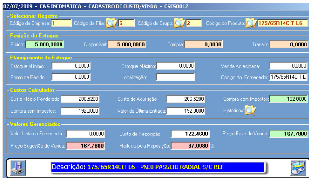
Figura – 01