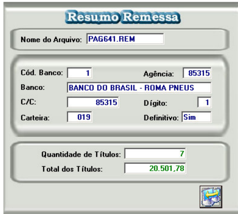
Figura - 03