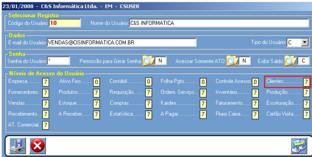
Figura – 01